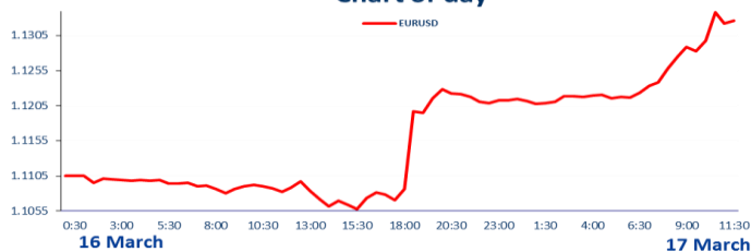
Chart of day

Preturile metalelor pretioase au crescut miercuri pe masura ce dolarul pierdea teren fata de celelalte valute majore dupa anuntul bancii centrale a SUA ca a scazut la doua reprizele de crestere a ratelor din cursul acestui an. Aurul se tranzactioneaza in jurul nivelului de 1,270.00 dolari pe uncie, pretul argintului a urcat la 15.70 dolari pe uncie, platina este cotata la 985.60 dolari pe uncie iar paladiul a urcat peste 585.00 dolari pe uncie.